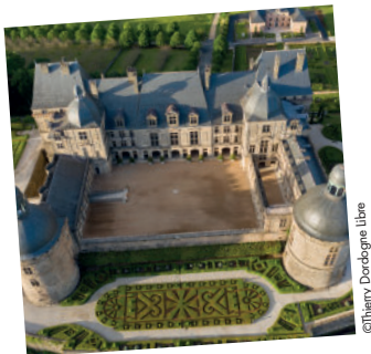
2. Hautefort et son château