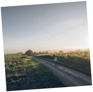
6. Cognac et son vignoble