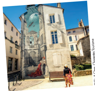
4. Angoulême, capitale de la BD