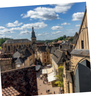
1. Sarlat-la-Canéda au cœur de la Dordogne