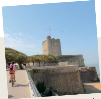
8. Fours-les-Bains, la presqu'île de Charente.