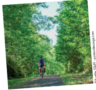
5. La coulée d'Oc et sa nature luxuriante