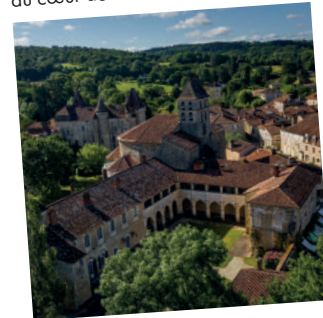
3. Saint-Jean-de-Côle et son patrimoine