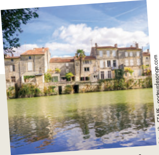
7. Saint-Savinien-sur-Charente, classée « Ville et Métiers d'Art »